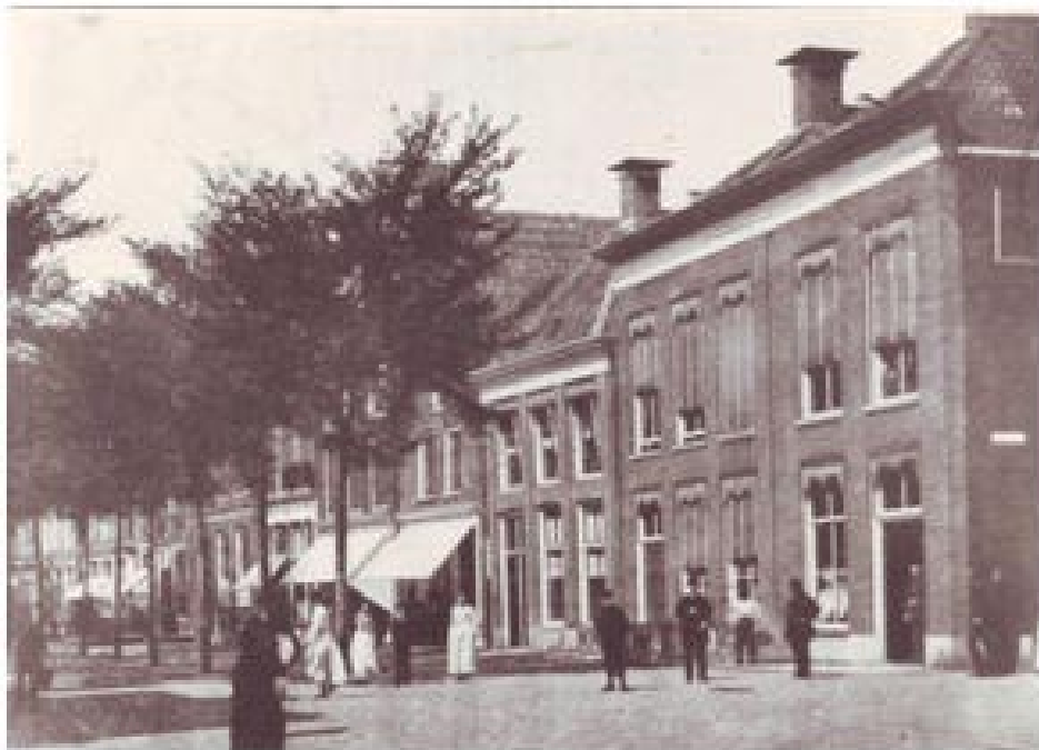
Harlingen, Voorstraat 27, 4e pand van rechts