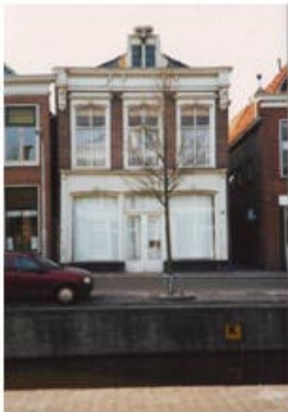
De Grote Dijklakker