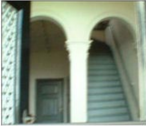
Een prachtige entree met hal en trappenhuis

IJsbrand overlijdt na een druk en sociaal bewogen leven 19 mei 1903, 58 jaar. Akke zal hem ruim 25 jaar overleven.