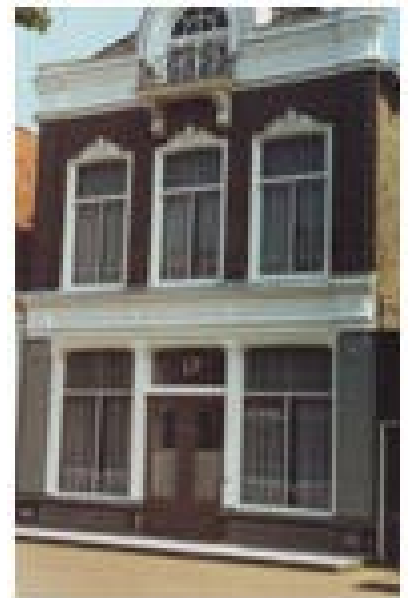
De Kleine Dijklakker 7

verklaard, hetgeen wil zeggen dat zij ook elders in het land in geval van oorlog konden worden ingezet. Dit is éénmaal het geval geweest tijdens de Belgische opstand van 1830-1839. In 1939 deed Klaas zelf aangifte.