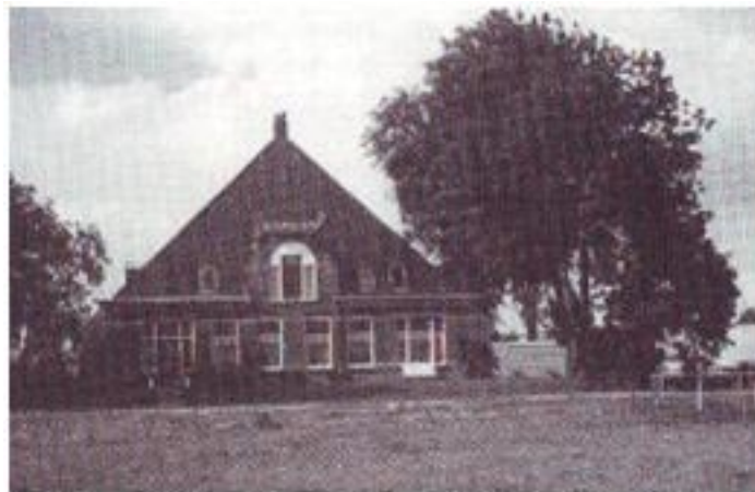
Jongedijk 2 te Nijland

Elf jaar later in 1878 verhuizen zij weer naar Bolsward, naar Halfweg Tjerkwerd II en nu voorgoed. Hierover aanstonds meer. Eerst noem ik in het kort alle kinderen, ook die jong overleden, hoewel ik hen niet 'mee-tel'.