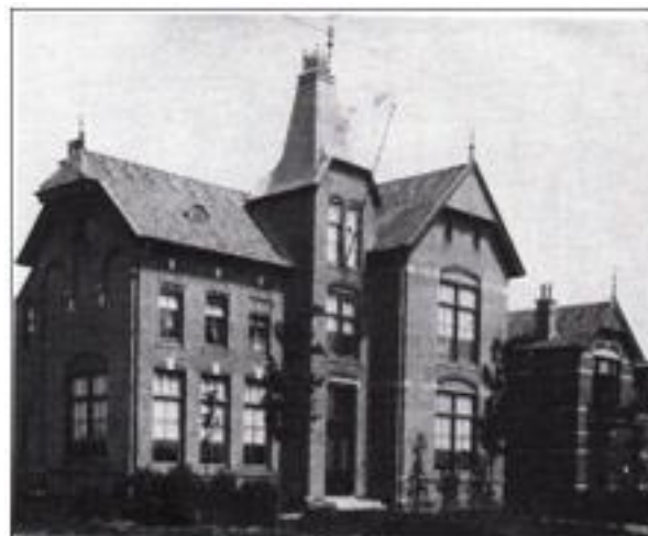
Zuivelschool in Bolsward (weleer)