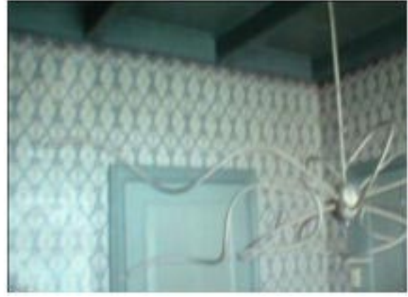
Een schitterend geheel betegelde kamer