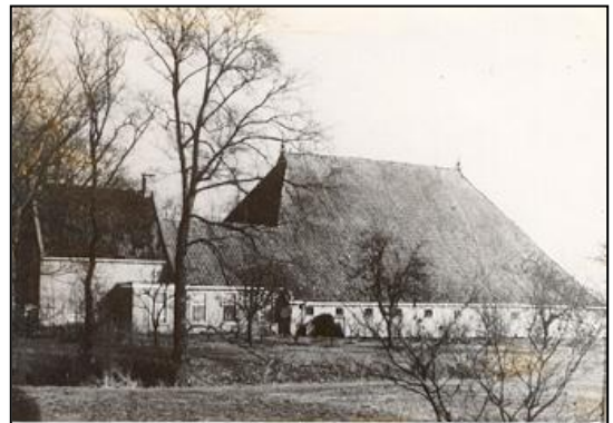
Boerderij Buwalda Stapert. "Us âldershús."